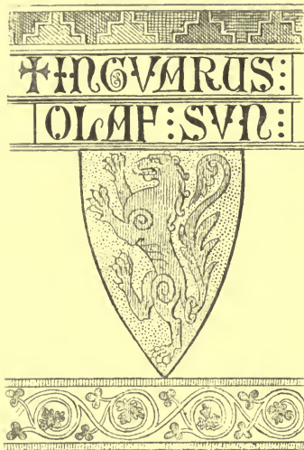
Fig. 4. Ingvar Olafsøns Skjold.

Dette Skjoldmærke, som fandtes 1871, var et af de bedst bevarede oprindelige Skjolde.